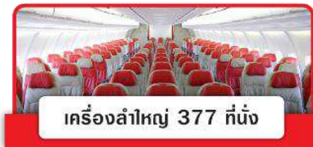
เครื่องลำใหญ่ 377 ที่นั่ง

(ขอสงวนสิทธิ์ในการเลือกที่นั่งบนเครื่องบิน เนื่องจากต้องเป็นไปตามระบบของสายการบิน)