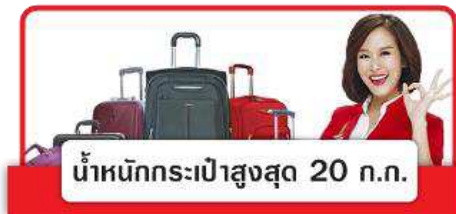
น้ำหนักกระเป๋าสูงสุด 20 ก.ก.

**หากต้องการอัพเกรดที่นั่งรถกวนแจ็งเซลล์ที่ท่านติดต่อเพื่อทำการเช็คที่นั่ง อัตราการให้บริการดังนี้**