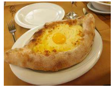
Ajarian khachapuri เป็นขนมหั่นไข่ดาวจิ๋ว ( มีเฉพาะเมืองบาคุมิ เท่านั้น)

อัตรานี้ไม่รวม ค่าทิปมัคคุเทศก์ท้องถิ่น - ทิปพนักงานขับรถ - ทิปหัวหน้าทัวร์จากเมืองไทย รวมค่าทิป 46 USD ต่อท่าน หรือ ประมาณ 1,520 บาทไทย - ไม่รวมค่าทิปพนักงานยกกระเป๋าตามโรงแรมที่พัก