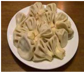
“Khinkali” เป็นอาหารทานเล่นที่ทำมาจากเนื้อสัตว์ผสมเครื่องปรุงต่างๆ แล้วจึงห่อด้วยแป้งเหมือนเสฉวนหลงเป่าที่เราคุ้นเคย