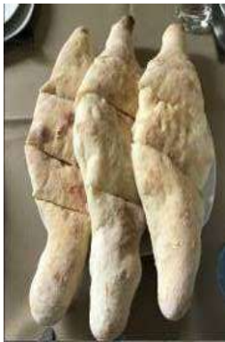
- คาซาบุรี ขนมหั่นหน้าชีสเข้มๆ

“Churchkhela” ขนมหวานทานเล่นที่ขึ้นชื่อ เป็นเม็ดถั่วทองถนอมหรือแช่ด้วยส้มเป็นแถวแล้วชุบด้วยแป้งเคี้ยวน้ำตาล