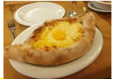
Ajarian khachapuri เป็นขนมนึ่งไข่ดาวซีฟ ( มีเฉพาะเมืองบาตุมิ เท่านั้น)

อัตรานี้ไม่รวม ค่าทิปมัดคุดเทศก์ท้องถิ่น - ทิปพนักงานขับรถ - ทิปหัวหน้าทัวร์จากเมืองไทย รวมค่าทิป 46 USD ต่อท่าน หรือ ประมาณ 1,520 บาทไทย - ไม่รวมค่าทิปพนักงานยกกระเป๋าตามโรงแรมที่พัก