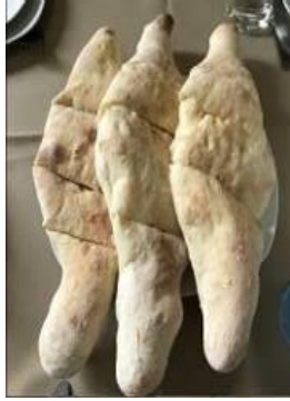
- คาซาปური ขนมนึ่งหน้าชีสเยิ้มๆ