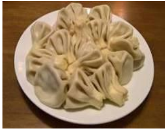
“Khinkali” เป็นอาหารทานเล่นที่ทำมาจากเนื้อสัตว์ผสมเครื่องปรุงต่างๆ แล้วจึงห่อด้วยแป้งเหมือนเสฉวนหลงเป่าที่เราคุ้นเคย