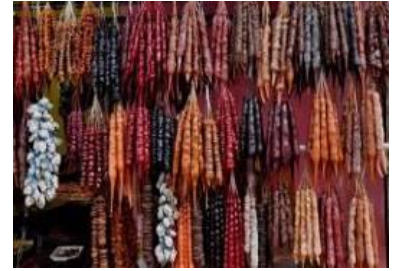
“Churchkhela” ขนมหวานทานเล่นที่ขึ้นชื่อ เป็นเม็ดถั่วทอดร้อนหรือแช่ด้วยกินเป็นแฉวยแล้วชุบด้วยแป้งเคี้ยวน้ำตาล