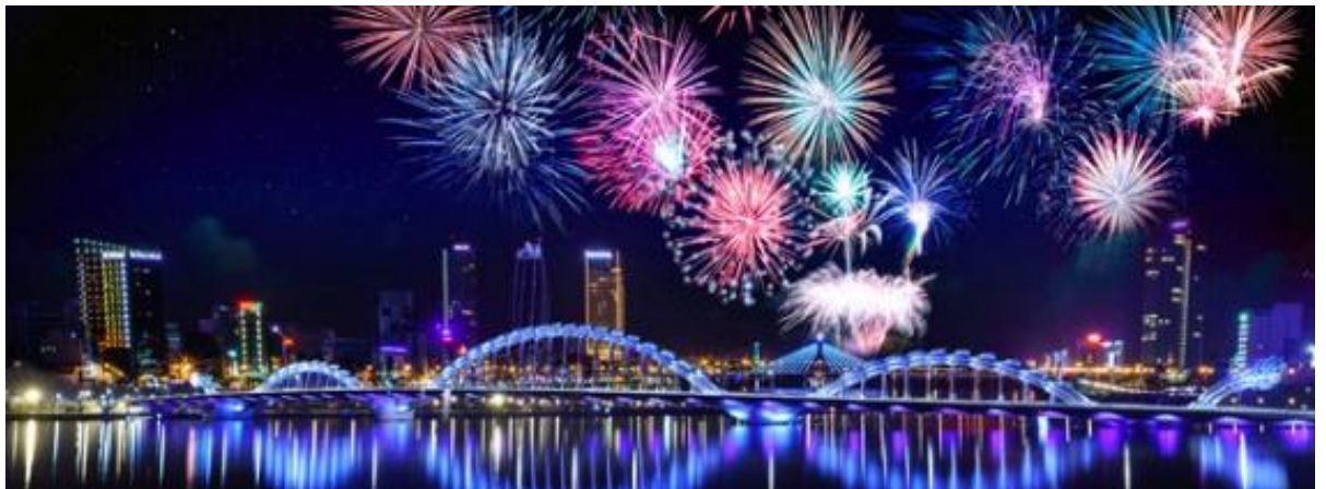
DANANG HAPPY NEW YEAR 2020

บริการอาหารเย็น ณ ภัตตาคารพื้น *Beer Plaza* อาหารบุฟเฟ่ต์นานาชาติ บานาฮิลล์ (4) โรงแรม Glamour hotel, Fivitel Boutique Hotel ระดับ 4 ดาว หรือเทียบเท่า