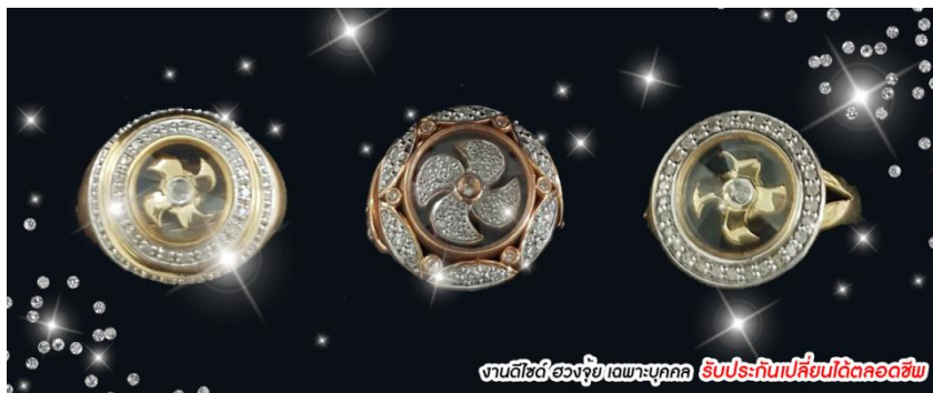
งานดีไซน์ ฮวงจุ้ย เฉพาะบุคคล รับประกันเปลี่ยนได้ตลอดชีพ

นำท่าน ชม ร้านจิวเวลรี่ DAIMOND IN LOVE ชมกังหันนำโชค ทำกังหันทุกชิ้นวางตามหลักฮวงจุ้ยโดยซินแซ ผ่านพิธีจากวัดแชกงหมิวฮ่องกง โดยได้ชื่อ ที่ทำพิธีใหญ่ให้ อยากรวย อยากรวย มีสิ่งดีๆเสริมฮวงจุ้ย ตัวใบพัดกังหันหมุนได้รอบทิศทาง หมุนไปมาตามการเคลื่อนไหวของร่างกาย ด้วยความเชื่อที่ว่า กังหันช่วยหมุนชีวิตพลิกผัน จากร้ายกลายเป็นดี จะช่วยดึงดูดนำพาสิ่งดีๆ เข้ามาในชีวิต ปิดเป่าสิ่งไม่ดีพัดออกไป พาชีวิตราบรื่น เจริญก้าวหน้า ทั้งหน้าที่การงาน โชคลาภ เงินทองวิ่งรับทรัพย์เหมือนกังหันที่ลู่ลม