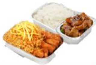
บริการอาหารร้อน ไป-กลับ บนเครื่อง

** เนื่องจากเป็นตั๋วเครื่องบิน จึงไม่สามารถรับชมอาหารได้ **