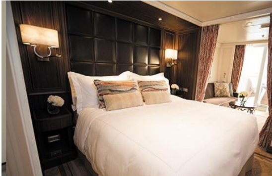
VERANDA SUITE – H SIZE: 307/28 DECK: 6, 7