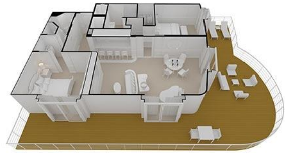
REGENT SUITE – RS SIZE: 4,443/412 DECK: 14