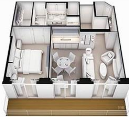
EXPLORER SUITE – ES SIZE: 821/76.2 DECK: 9, 10, 12