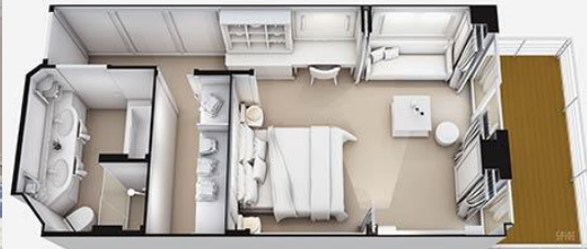
CONCIERGE SUITE – E SIZE: 415/38.5 DECK: 6, 7, 8, 9