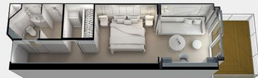
SUPERIOR SUITE - F2 SIZE: 415/38.5 DECK: 7, 8, 9