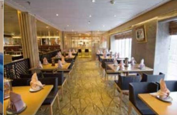
Sushi Bar Japanese cuisine