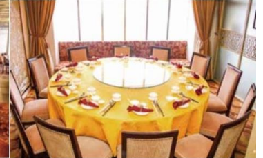
Iaipan Chinese cuisine