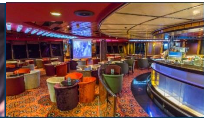
Karaoke Lounge / KTV