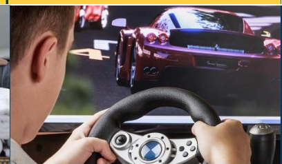
ESC Experience Lab