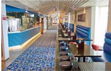
Blue Lagoon Asian snacks, 24-hour