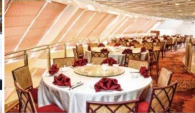
Genting Palace Chinese cuisine