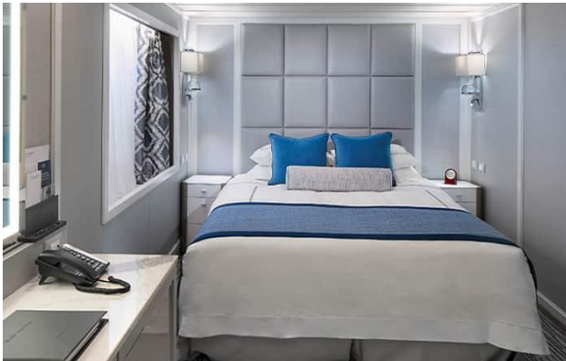
ห้องพักแบบหน้าต่าง E - Ocean View Deck 6 Size 143 / 13 SQ FT / SQ M