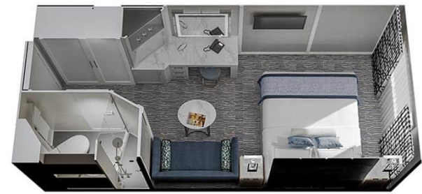
ห้องพักมีระเบียง B2 - Veranda Stateroom Deck 6 Size 1216 / 20 SQ FT / SQ M