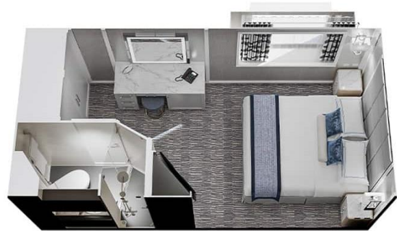
ห้องพัก แบบมีหน้าต่าง C2 - Deluxe Ocean View Deck 4 Size 165 / 15 SQ FT / SQ M