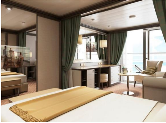
Classic Veranda Suite 36 m 2