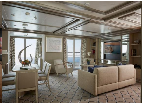
Owner's Suite 88 - 98 m 2 / 119 - 129 m 2

เพื่อประโยชน์ของผู้เดินทาง โปรดศึกษาเงื่อนไขการจองทัวร์ และการยกเลิกทัวร์ ที่ระบุในรายการทั้งหมด หลังจากท่านทำการจองทัวร์แล้ว ทางบริษัทฯจะถือว่าท่านเข้าใจ และพร้อมปฏิบัติตามเงื่อนไขดังกล่าว