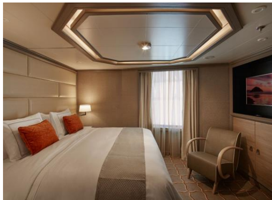
Royal Suite 105 m 2 / 142 m 2