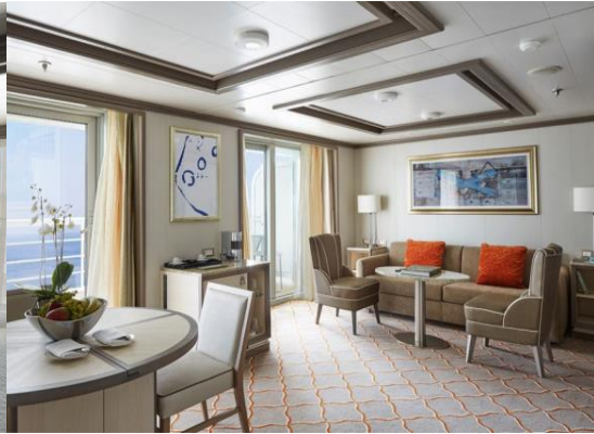
Silver Suite 73 m 2