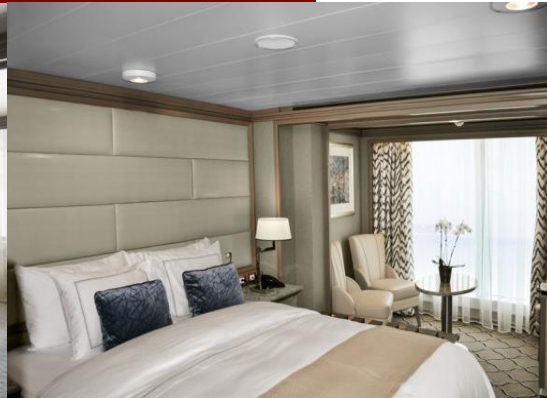
Panorama Suite 31 m 2