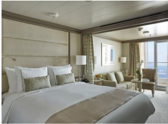
Deluxe Veranda Suite 36 m 2