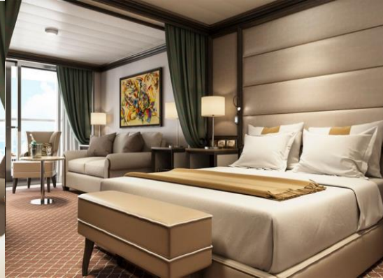
Superior Veranda Suite 36 m 2