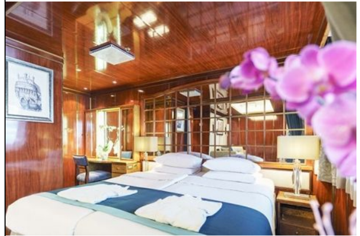
Passengers: 2 Size: 30 M 2 (323 FT 2 ) View: Private balcony