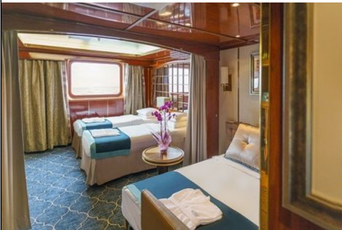
Passengers: 3 Size: 21 M 2 (226 FT 2 ) View: picture window