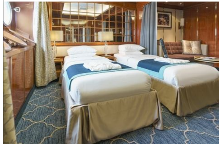
Passengers: 2 Size: 23 M 2 (248 FT 2 ) View: Portholes