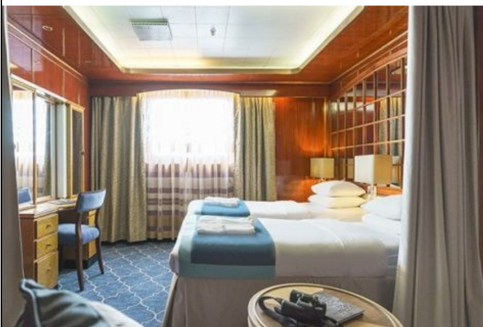
Passengers: 2 Size: 21 M 2 (226 FT 2 ) View: picture window