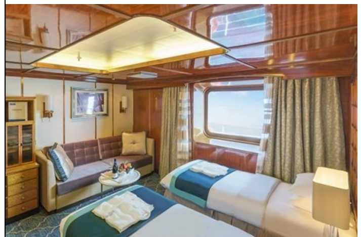
Passengers: 2 Size: 20 M 2 (215 FT 2 ) View: Picture window