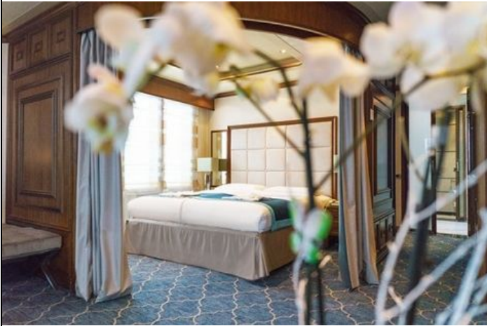
Passengers: 2 Size: 43 M 2 (463 FT 2 ) View: PRIVATE DECK