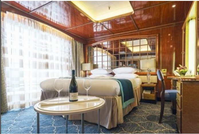
Passengers: 2 Size: 24 M 2 (258 FT 2 ) View: Private balcony