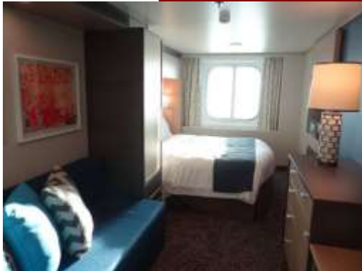
ห้องมีหน้าต่าง Ocean view stateroom