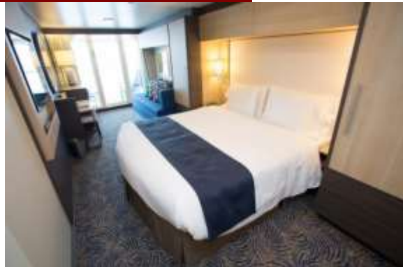
ห้องมีระเบียง Balcony stateroom

อัตราค่าบริการ ต่อท่าน งตแลมกระเป่า วันที่ 11-16 ม.ค. 63