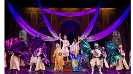
Disney's Aladdin - A Musical Spectacular