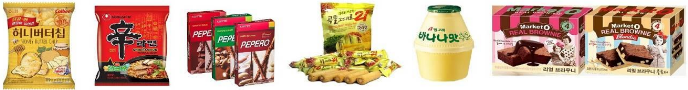
สินค้าร้านค้าสนามบิน

แล้วพาท่านละลายเงินวอนที่ ร้านค้าสนามบิน หรือซูเปอร์มาร์เก็ต ซึ่งท่านสามารถเลือกซื้อสินค้าพื้นเมืองเป็นการส่งท้ายก่อนอำลาเกาหลี อาทิ บะหมี่ชินรามยิบ อุด้ง กิมจิ ลูกอมรสแปลกๆ บราวน์ ันันี่บัตเตอร์ชิพ ถั่วรสต่างๆ ป๊อกรีสต่างๆ นมกล้วย ขนมช้ญพีช และอื่นๆอีกมากมาย