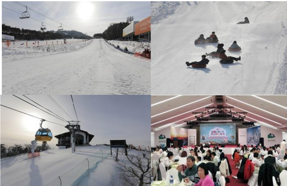
เทศกาลหิมะ ณ ยงเพียงสกีรีสอร์ท

ค่ำ รับประทานอาหารเย็น (2) GALA DINNER ณ ยงเพียงรีสอร์ท ที่พัก YONGPYEONG SKI RESORT