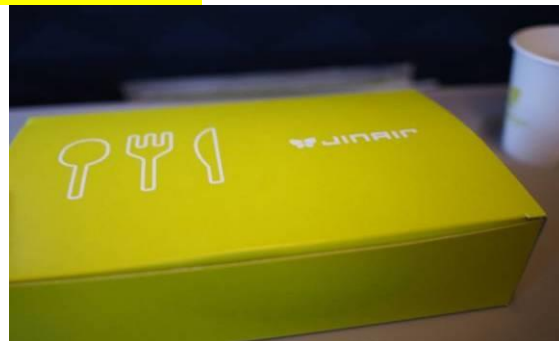
(มีอาหารบริการบนเครื่องเป็น BOX SET)

วันที่ 2 ไร่สตรอเบอร์รี่ - เทศกาลหิมะ ณ ยงเพียงสกีรีสอร์ท (การแข่งขันเล่นเลื่อนหิมะ ขึ้นเคเบิลคาร์ เล่นสกี)