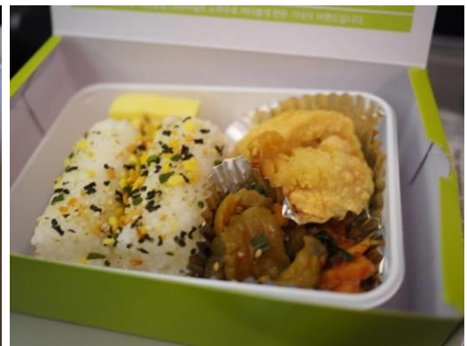
(มีอาหารบริการบนเครื่องเป็น BOX SET)