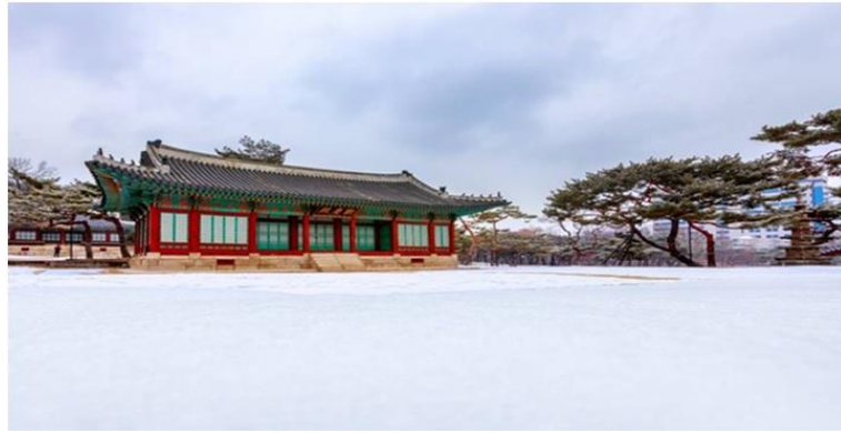
พระราชวังชางด็อกกุง