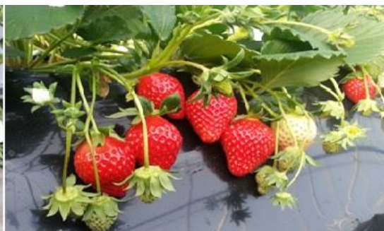
ไร่สตรอเบอร์รี่

เที่ยง รับประทานอาหารกลางวัน (1) เมนูชาบูชาบูสไตล์เกาหลี