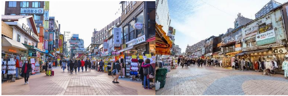
ตลาดซองฮิก