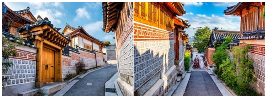
หมู่บ้านบุกชอนฮันอก (Bukchon Hanok Village)

จากนั้นเดินทางไปยัง หมู่บ้านบุกชอนฮันอก (Bukchon Hanok Village) เป็นอีกหนึ่งสัญลักษณ์ของเกาหลีท่ามกลางตึกรามบ้านช่องที่ทันสมัยของกรุงโซลนั้น หมู่บ้านแห่งนี้ก็ยังคงรักษาอาคารบ้านเรือนในสมัยโบราณ มีกลิ่นอายของเกาหลีในยุคเก่าแก่ ท่านจะได้พบกับบ้านของขุนนางระดับสูงของเกาหลีในสมัยก่อน ภายในหมู่บ้านมีอาคารแบบดั้งเดิมของเกาหลีกว่า 100 หลัง (รูปแบบบ้านแบบดั้งเดิมของเกาหลีเรียกว่า ฮันอก (hanok)) ซึ่งเก่าแก่มากตั้งแต่สมัยโชซอน ในปัจจุบันนี้บ้านฮันอกหลายหลังในหมู่บ้านถูกดัดแปลงให้เป็นศูนย์วัฒนธรรม เกสต์เฮาส์ ร้านอาหาร และโรงน้ำชา เปิดให้บริการแก่นักท่องเที่ยวที่เข้ามาเพื่อสัมผัสและเรียนรู้วัฒนธรรมเกาหลีแบบดั้งเดิม และอีกหนึ่งสิ่งที่สำคัญก็คือหมู่บ้านนี้เป็นย่านที่มีคนเกาหลีอยู่อาศัยกันจริงๆ ภายในบ้าน