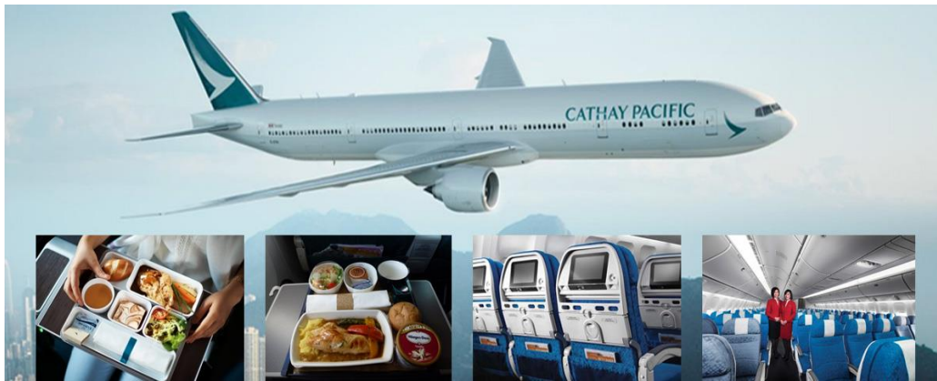
(บริการอาหารและเครื่องดื่มบนเครื่อง)

18.15 น. เดินทางถึง ฮ่องกง สนามบิน Chek Lap Kok