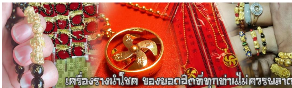
เครื่องรางนำโชค ของยอดฝีมือทุกท่านไม่ควรมองข้าม

เครื่องรางที่นิยมสวมใส่อยู่ในปัจจุบัน ซึ่งบางท่านอาจจะกำลังมองหาเพื่อนำมาเป็นของขวัญให้กับบุคคลที่ท่านรักหรือนับถือ หรือท่านที่กำลังมองหางานฮวงจุ้ยดีๆ สักชิ้นเพื่อเสริมดวง แก้ป凶 ปิดเป่าสิ่งชั่วร้าย เรามีบริการแนะนำ อีกมากมาย หลากหลายรายการ ซึ่งหัวหน้าทัวร์และไกด์ท้องถิ่นจะคอยอำนวยความสะดวกในการให้รายละเอียดกับคุณลูกค้า ณ วันเดินทางค่ะ