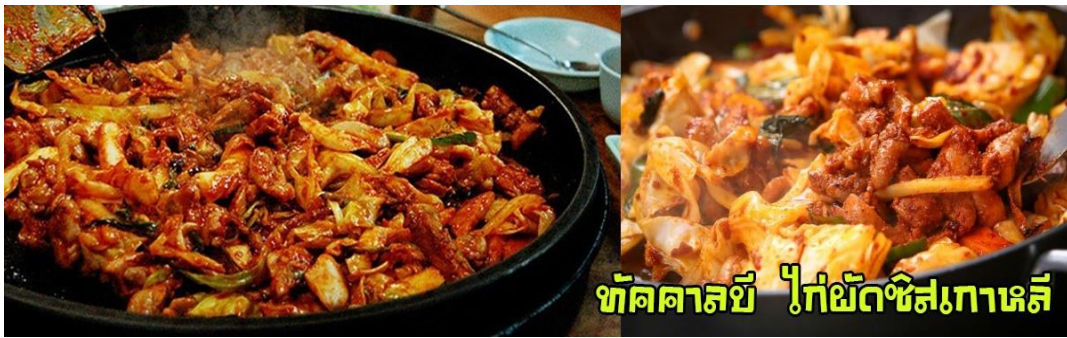
ทักคัลบี้ ไก่ผัดซอสเกาหลี

หลังจากนั้น นำทุกท่านสู่ลานสกี ให้ทุกท่านสนุกสนานกับการเล่นสกี หรือ กระดานเลื่อนหิมะ สัมผัสหิมะและสถานที่อันงดงาม พร้อมถ่ายรูปเป็นที่ระลึกได้ (ผู้สนใจเช่าอุปกรณ์เครื่องเล่นให้ติดต่อหัวหน้าทัวร์เพราะราคานี้ไม่รวมค่าเช่าอุปกรณ์ , สกิลิฟท์ สกีก่าเล่นรวมชุดประมาณ 50,000 วอน และ กรุณาเตรียมถุงมือสกี ผ้าพันคอ แว่นกันแดด เสื้อแจ็กเก็ตกันน้ำ หรือ ผ้าร่มและกางเกงที่เหมาะสม)