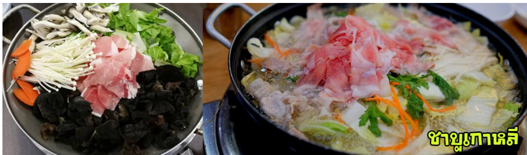
ชาบูเกาหลี

จากนั้นนำท่านเข้า สู่ที่พัก New M Hotel หรือเทียบเท่า