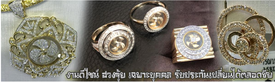
งานที่เพชร สรวงสุข เหมะบุศุศล รับประกันเปลี่ยนไม่ติดตลอดชีพ

จากซินแสประจำร้าน เพื่อแนะนำวิธีการเสริมดวงในการสวมใส่โดยไม่คิดค่าบริการ)