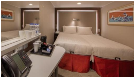
ห้องพักไม่มีหน้าต่าง