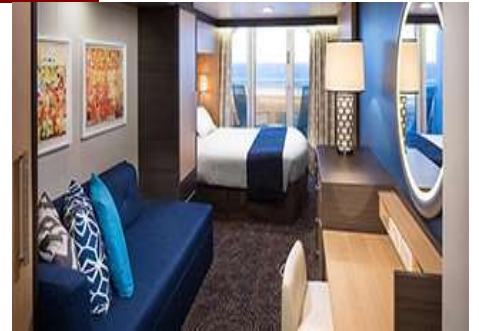
ห้องไม่มีหน้าต่าง INTERIOR STATEROOM ห้องมีหน้าต่าง OCEANVIEW STATEROOM ห้องมีระเบียง BALCONY STATEROOM