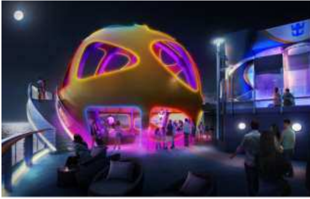
SKY PAD SM