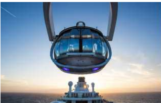
THE NORTH STAR