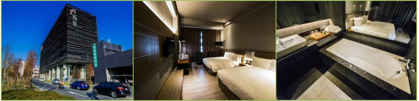
พักที่ โรงแรม ORIENT LUXURY HOTEL CHIAYI ระดับ 4 ดาว ++หรือเทียบเท่า

เย็น รับประทานอาหาร ณ ภัตตาคาร เมนู สเต็ก หมู เนื้อ ไก่ + สลัดบาร์ และ เครื่องดื่ม .