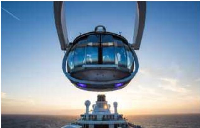
THE NORTH STAR