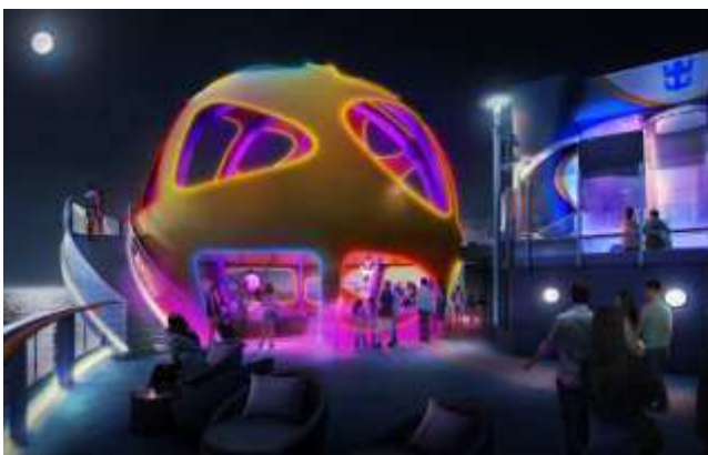
SKY PAD SM