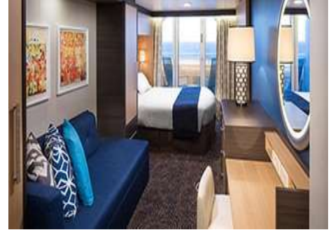
ห้องไม่มีหน้าต่าง INTERIOR STATEROOM ห้องมีหน้าต่าง OCEANVIEW STATEROOM ห้องมีระเบียง BALCONY STATEROOM