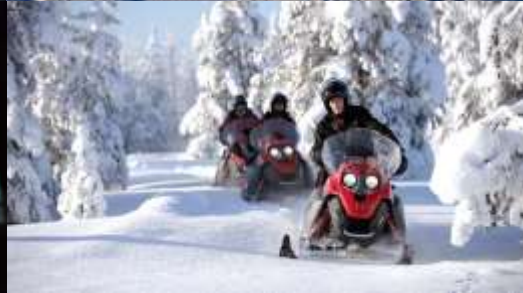
Northernlight Glass Igloo Hotel

เฮลซิงกิ - เคมิ - เรือตัดน้ำแข็งไอซ์เบอร์เกอร์ - ปราสาทหิมะ - โรวานีเยมิ - หมู่บ้านซานตาคลอส