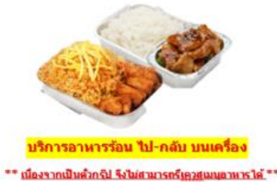
บริการอาหารร้อน ไป-กลับ บนเครื่อง

** เนื่องจากเป็นคั้งปี จึงไม่สามารถจองเมนูอาหารได้ **