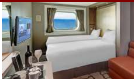
Ocean view Room