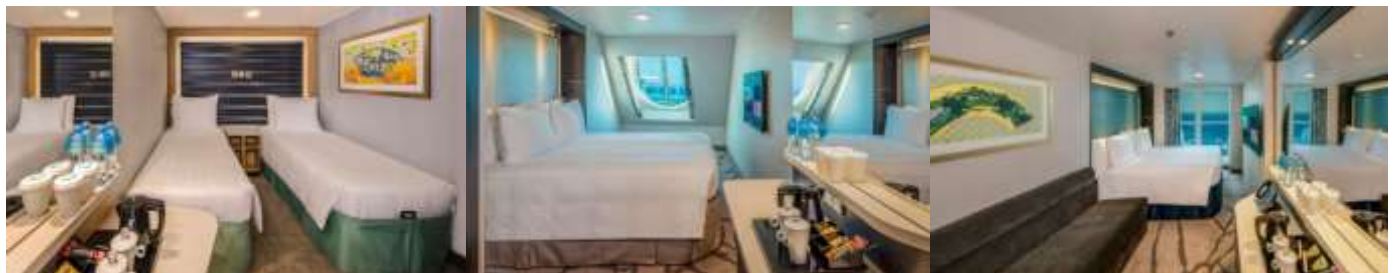
ห้องพักไม่มีหน้าต่าง