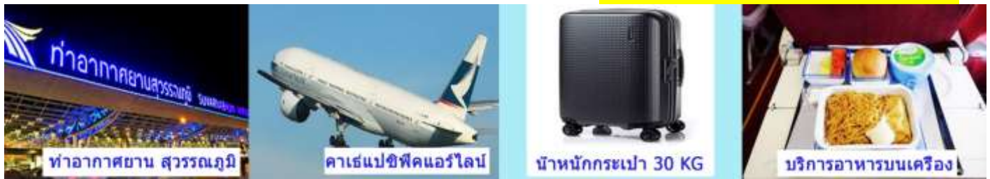
23.40 เดินทางสู่สนามบินสุวรรณภูมิ

21.35 น. เดินทางกลับสู่ประเทศไทย โดย สายการบิน คาเธ่แปซิฟิก เที่ยวบินที่ CX617 (บริการอาหารบนเครื่อง)