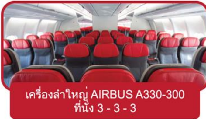
เครื่องบินใหญ่ AIRBUS A330-300 ที่นั่ง 3 - 3 - 3