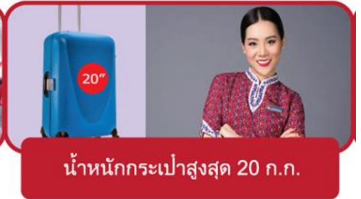
น้ำหนักกระเป๋าสูงสุด 20 ก.ก.

01.00 น. ออกเดินทางสู่ ท่าอากาศยานนานาชาติ นาริตะ ประเทศญี่ปุ่น โดยสายบิน THAI LION AIR เที่ยวบินที่ SL 300