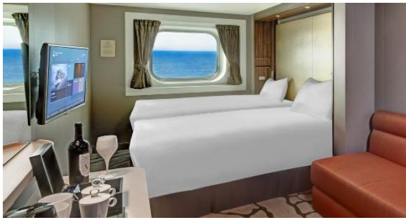
ห้องพักแบบมีหน้าต่าง Oceanview