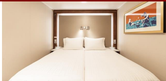
ห้องพักแบบไม่มีหน้าต่าง Inside

ตัวอย่างห้องพักบนเรือสำราญ Genting Dream By Dream Cruise