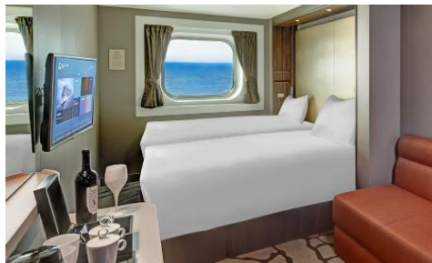
ห้องพักแบบมีหน้าต่าง Oceanview