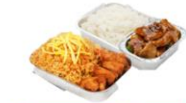
บริการอาหารร้อน ไป-กลับ บนเครื่อง

** เนื่องจากเป็นตู้จป จึงไม่สามารถเสิร์ฟอาหารได้ **