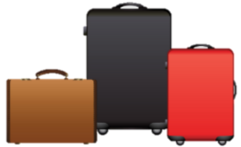
น้ำหนักกระเป๋า 20 กิโลกรัมต่อ

** เนื่องจากเป็นตู้จป จึงไม่สามารถเสิร์ฟอาหารได้ **