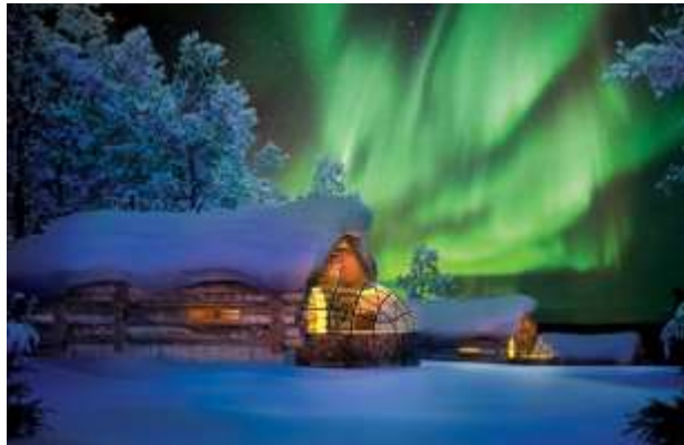
พักที่ Kelo Glass Igloos แห่งเดียวในโลก

อัตรานี้ไม่รวม ค่าทิปหัวหน้าทัวร์ และไกด์ท้องถิ่น