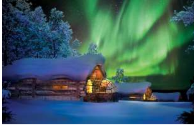
พักที่ Kelo Glass Igloos แห่งเดียวในโลก