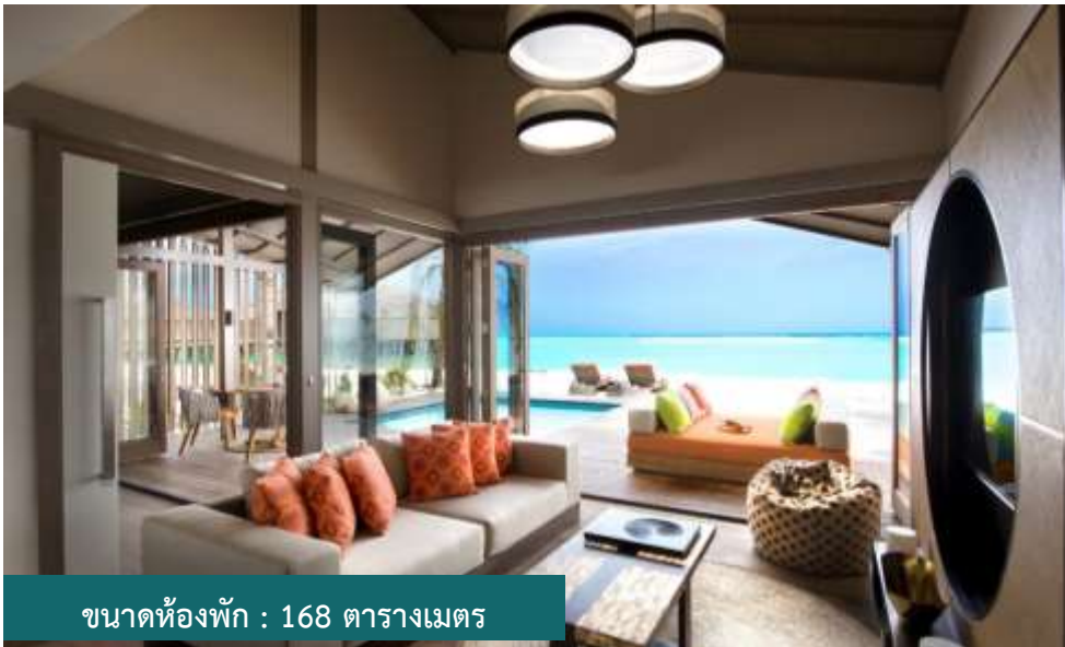
ขนาดห้องพัก : 168 ตารางเมตร