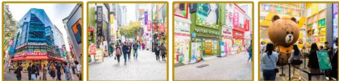
จุดเช็คอินที่ 6 เมืองดง

เป็นย่านที่ได้ชื่อว่ารวบรวมแฟชั่นแบรนด์ชั้นนำไว้มากมาย ท่านสามารถหาซื้อสินค้าได้อย่างหลากหลายทั้งเสื้อผ้า, รองเท้า, กระเป๋า, เครื่องสำอาง และยังมี เครื่องประดับ ฯลฯ นอกจากนี้ท่านสามารถพบกับร้าน LINE FRIENDS STORE ที่จำหน่ายสินค้าของที่ระลึกเกี่ยวกับตัวการ์ตูน LINE ซึ่งแต่ละตัวจะมีสินค้าที่ระลึกให้เลือกซื้อหลากหลายชนิด