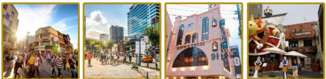
จุดเช็คอินที่ 7 อองแด

เป็นย่านที่ได้ชื่อว่ารวบรวมแฟชั่นแบรนด์ชั้นนำไว้มากมาย ท่านสามารถหาซื้อสินค้าได้อย่างหลากหลายทั้งเสื้อผ้า, รองเท้า, กระเป๋า, เครื่องสำอาง และยังมี เครื่องประดับ ฯลฯ นอกจากนี้ท่านสามารถพบกับร้าน LINE FRIENDS STORE ที่จำหน่ายสินค้าของที่ระลึกเกี่ยวกับตัวการ์ตูน LINE ซึ่งแต่ละตัวจะมีสินค้าที่ระลึกให้เลือกซื้อหลากหลายชนิด