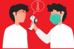
วัดไข้ผู้เดินทาง