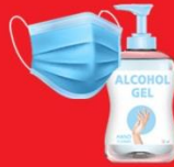
แจกแมส, เจล