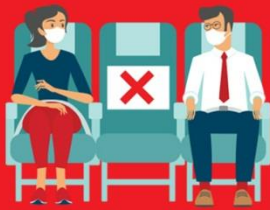
สายการบิน