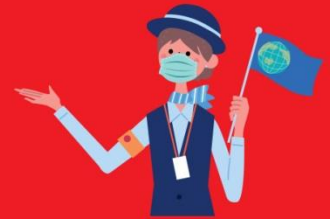
ไกด์ใส่แมสตลอดเวลา