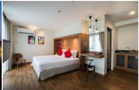
โรงแรม Grand Jomtien Palace http://grandjomtienpalace.co.th/ ★★★★★