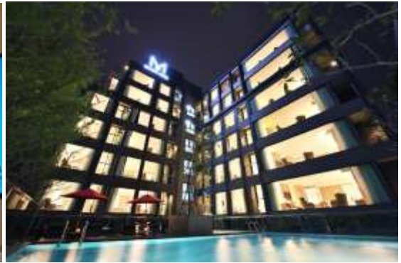
โรงแรม Mike Garden Resort https://www.mikegardenresort.com/ ★★★★★