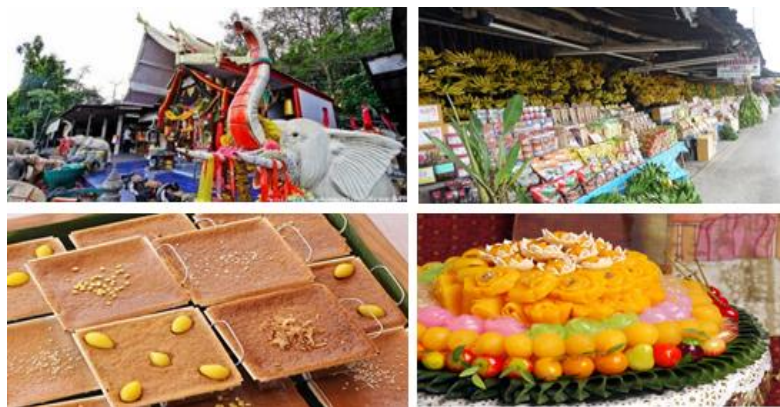
อาหารค่ำ อิสระตามอัธยาศัย

12.30 น. รับประทานอาหารกลางวัน ณ ร้านอาหารคุณตัน ทับสะแก (7) หลังอาหารเดินทางกันต่อ ระหว่างทางกลับแวะซื้อของฝากของดีเมืองเพชร โดยเฉพาะ “ขนมหม้อแกง” “ทองหยิบ” “ทองหยอด” ฯลฯ ที่เป็นขนมขึ้นชื่ออันดับต้นๆ ของประเทศเหมาะซื้อไปเป็นของฝากก่อนกลับ