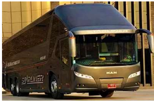
บัสวีไอพี มีเบาะนวด

สัมผัสความสะดวกสบายกับรถบัสสมรรถนะสูง ใหม่ล่าสุดจากยุโรป หูหรามมีระดับ ตัวรถถูกออกแบบพิเศษแข็งแรงมีระบบความปลอดภัยด้วยเทคโนโลยีมาตรฐานยุโรป เบาะนั่งเป็นเก้าอี้หนังรองรับสรีระร่างกายได้ดี มีที่ชาร์จ USB ทุกที่นั่ง