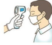
วัดไข้ผู้เดินทาง