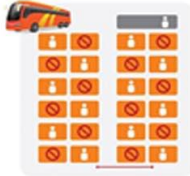
ที่นั่งบนรถ