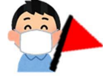
ใส่แมสตลอดเวลา

ไม่รวมค่าทิปไกด์และทีมงานคนขับรถ ท่านละ 200.- บาท ชำระพร้อมค่าทัวร์