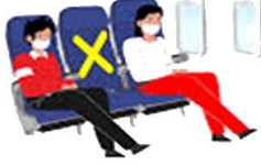
ที่นั่งบนเครื่องบิน