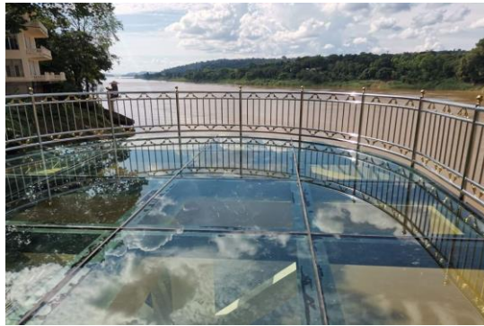
Sky Walk วัดหินหมากเป้ง

นำคณะไหว้ เจดีย์หลวงปู่เทสก์ เทสรังสี ที่ วัดหินหมากเป้ง ในบรรยากาศสงบร่มรื่นริมฝั่งแม่น้ำโขงหรือชื่ออย่างเป็นทางการเรียกว่า เจดีย์พิพิธภณธ์ พระราชชินโรจรังสีฯ และชม SKY WALK สกายวอล์ค แห่งที่สอง ของจังหวัดหนองคายก่อนเดินทางชม วัดผาตากเสื้อ ที่ตั้งอยู่บนเขาในเขตอำเภอสังคม จังหวัดหนองคาย เป็นวัดที่มีทิวทัศน์สวยงามมาก สูงจากระดับน้ำทะเล 550 เมตรพร้อมกับสัมผัสกับ “ สกายวอล์ค ” กระจกใสที่แรกของประเทศไทย เป็นจุดชมวิวที่ ยื่นออกไปจากหน้าผา สามารถมองเห็นวิวแม่น้ำโขง และเมืองสังข์ทอง ประเทศลาว