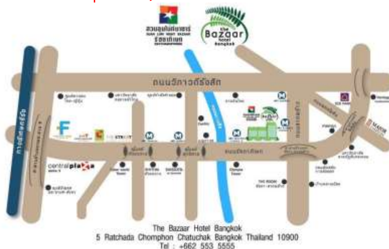
The Bazaar Hotel Bangkok 5 Ratchada Chomphon Chatuchak Bangkok Thailand 10900 Tel : +662 553 5555

20.00 น. ออกเดินทางสู่ จังหวัดนครพนม ให้ท่านพักผ่อนตามอัธยาศัย (หากมา ช้าเกินกว่านี้ ท่านจะตกทริป และไม่สามารถเรียกร้องค่าเสียหายใดๆ ได้ทั้งสิ้น)