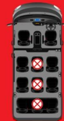
เว้นที่นั่งบนรถ