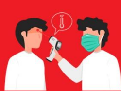
วิถีชีวิตเดินทาง