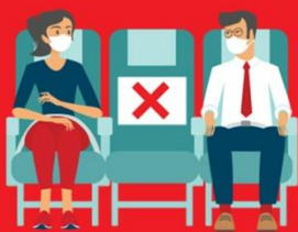
สายการบิน