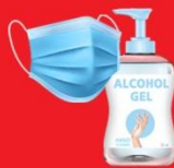
แจกแมส, เจล