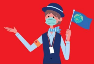
ใกล้ชิดแมสตลอดเวลา

คำแนะนำ สำหรับผู้เดินทางที่ไม่ได้อยู่จังหวัดเดียวกับสนามบินที่ทริปเดินทาง และ/หรือ จำเป็นต้องซื้อตัวเครื่องบิน หรือการเดินทางรูปแบบอื่นๆ มายังสนามบินที่ทริปเดินทาง ก่อนออกตัวเครื่องบิน ภายในประเทศ / ระหว่างประเทศ หรือซื้อตั๋วรถไฟ หรือ