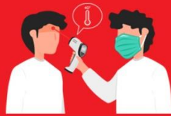
วัดไข้ผู้เดินทาง