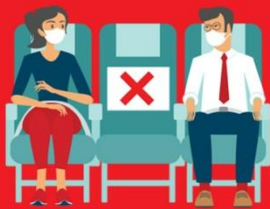
สายการบิน