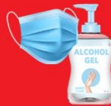
แจกแมส, เจล