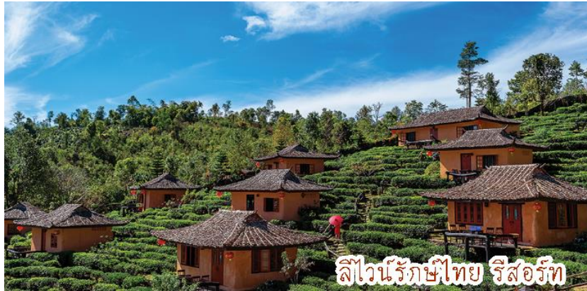
ลิโวนไร่ชาไทย ริสอร์ท

10.00 น. ขณะเดินทางถึง ถ้ำปลา อีสระให้ท่านเที่ยวชม และถ่ายรูปกับฝูงปลาพวงนับแสน ๆ ตัว เดินทางสู่ ถ้ำน้ำลอด