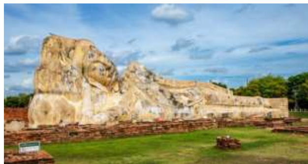
วัดโลกยสุธาราม