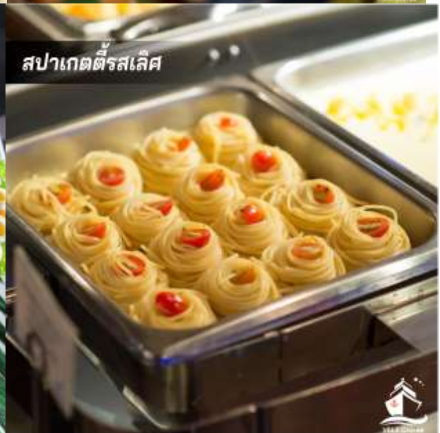
สปาเกตตีสเลิศ