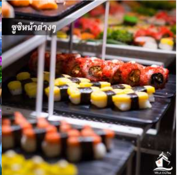
ซูชิหน้าต่างๆ