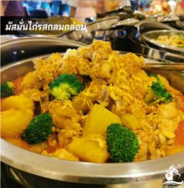
มีสมันไก่รสกลมกล่อม