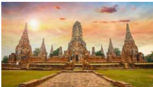
วัดไชยวัฒนาราม