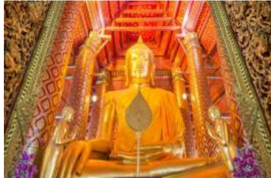
วัดพนัญเชิง