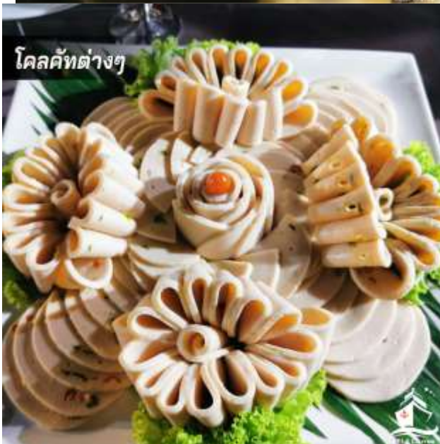
โดลคัทต่างๆ