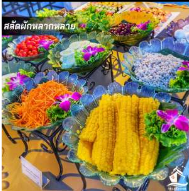
สลัดผักหลากหลาย