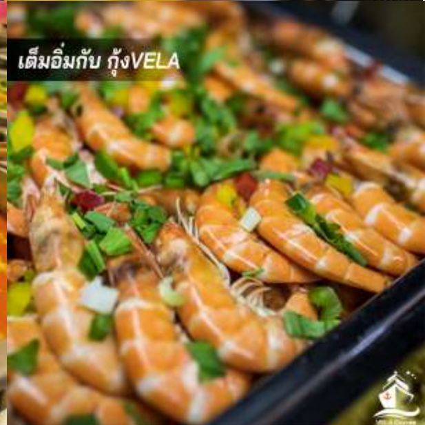
เต็มอิ่มกับ กุ้งVELA