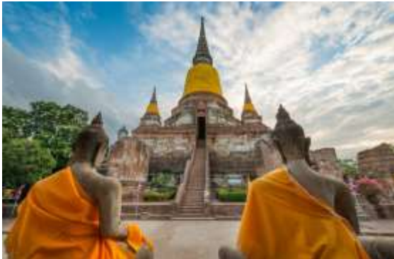
วัดใหญ่ชัยมงคล