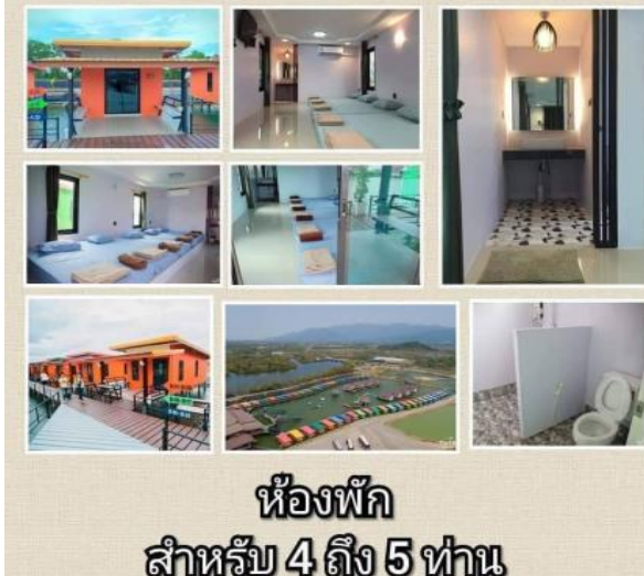
ห้องพัก สำหรับ 4 ถึง 5 ท่าน