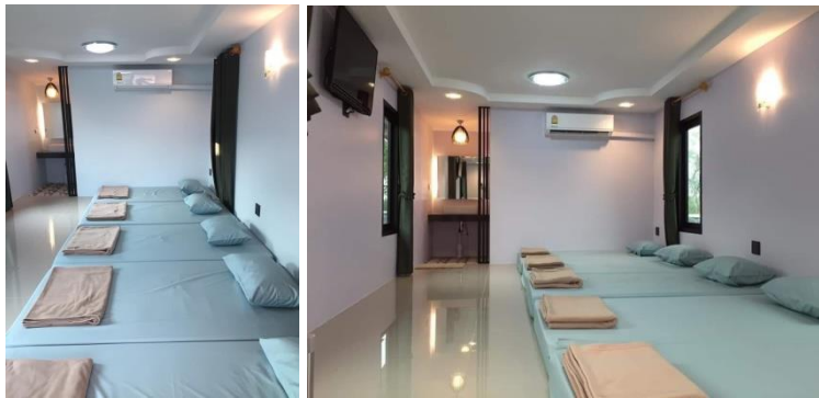
แบบแพ้รวมกัน 4 ท่าน ต่อห้อง