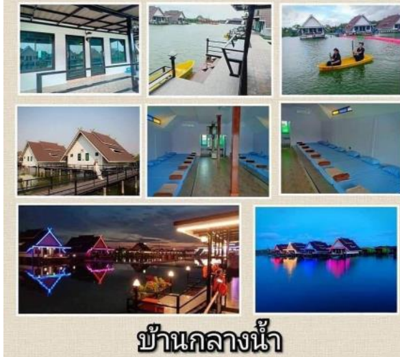
บ้านกลางน้ำ