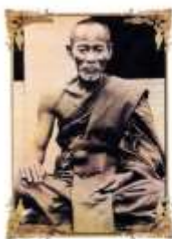
หลวงพ่อรวย พุทธธัมม วิมลญาณ พุทธบริษัท