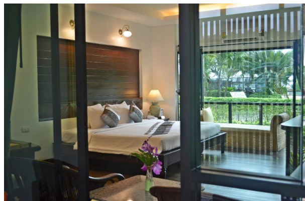
Up เป็นห้องพักแบบ วิลล่า ชำระเพิ่ม ท่านละ 1,000 บาท