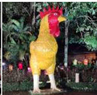
จากนั้นนำท่านรับประทานอาหารค่ำ ร้านต้าเหยิน ร้านเก่าแก่ดั้งเดิม สูตรอาหารต้นตำรับ จากเมืองจีน เมนู เค้หายก ผัดผักน้ำ