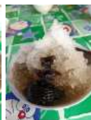
จากนั้นเดินทางต่อ เข้าจังหวัดยะลา ทานสะเต๊ะขึ้นชื่อร้านดังของเมืองยะลา Maki Café