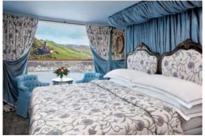
FRENCH BALCONY (196 SQ.FT.)