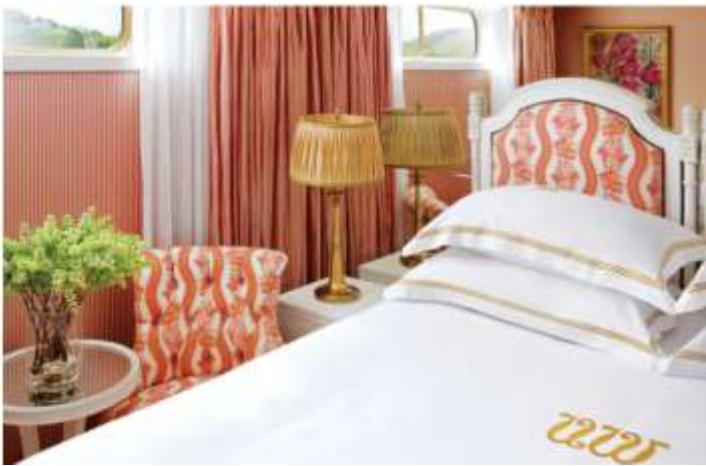
CLASSIC (163 SQ.FT.)