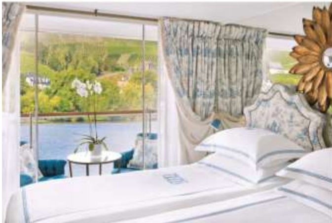
DELUXE BALCONY (196 SQ.FT.)