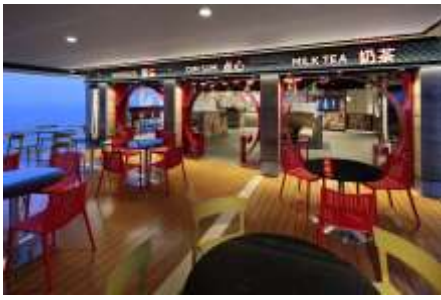
Kung Fu Panda