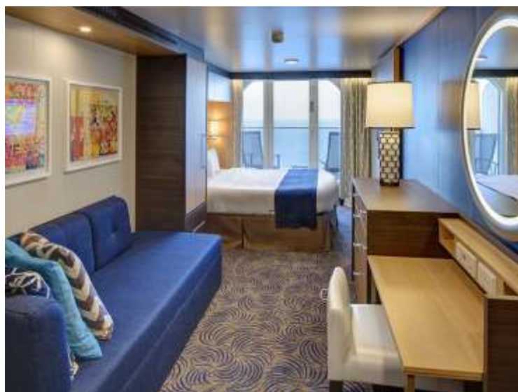
ห้องพักแบบ Balconv (ห้องพักรับเบียง วีวทะเล)