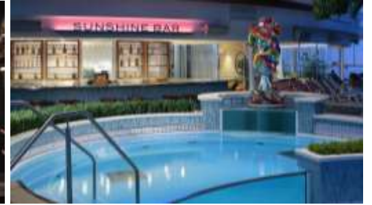
Sun shine Bar