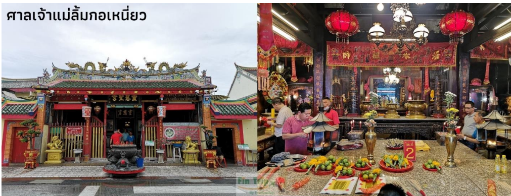
ศาลเจ้าแม่ลิ้มกอเหนี่ยว

08.05 น. เดินทางถึง สนามบินหาดใหญ่ ให้ท่านรับสัมภาระให้เรียบร้อย ไกด์นำเที่ยวรอท่านอยู่ด้านนอกที่จุดนัดพบ จากนั้นนำท่านออกเดินทางสู่จังหวัดปัตตานี โดยรถตู้ปรับอากาศ *หากต้องการเลือกที่นั่งบนรถมีค่าบริการ เพิ่มเติม* (ระยะทาง 118 ก.ม. ใช้เวลาเดินทาง 2 ชั่วโมง โดยประมาณ) จากนั้นนำท่านชม ศาลเจ้าแม่ลิ้มกอเหนี่ยว เชื่อกันว่าผู้มาขอพรให้โชคลาภจะได้ผล หรือแม้แต่การค้าขายที่ซบ เซาหรือขาดทุนก็กลับรุ่งเรืองขึ้นจนทำให้เกิดความนับถือศรัทธาอย่างมาก ชาวปัตตานีจึงได้นำต้นไม้ที่ลิ้มกอเหนี่ยว ผูกคอตายมาแกะสลักเป็นรูปบูชาและรสร้างศาลเจ้าขึ้นสักการะ สำหรับองค์เจ้าแม่ลิ้มกอเหนี่ยว ท่านเป็นเทพเจ้า แห่งความเมตตาโชคลาภ ค้าขาย ซึ่งเป็นที่นิยมมากราบไหว้ขอพรเพื่อเป็นสิริมงคลกับชีวิต