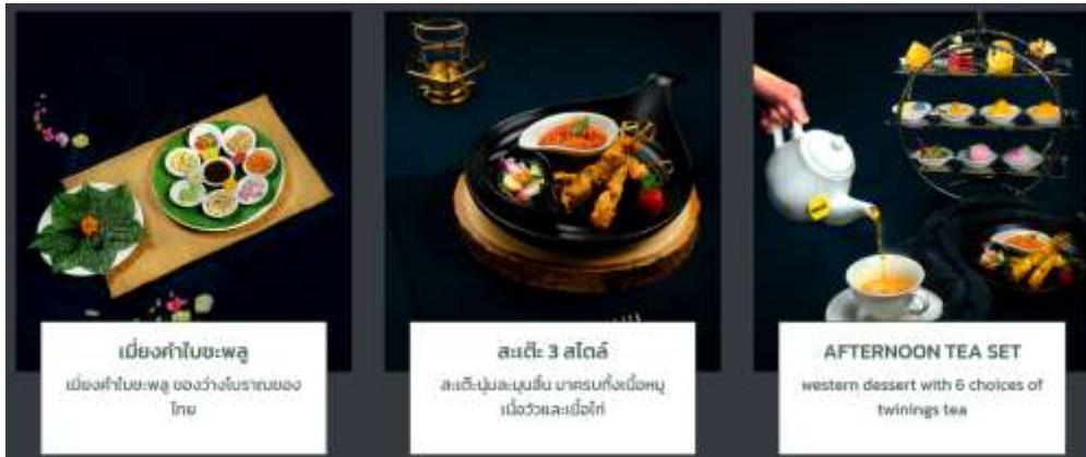
เมี่ยงคำใบชะพลู เมี่ยงคำใบชะพลู ของว่างโบราณของไทย